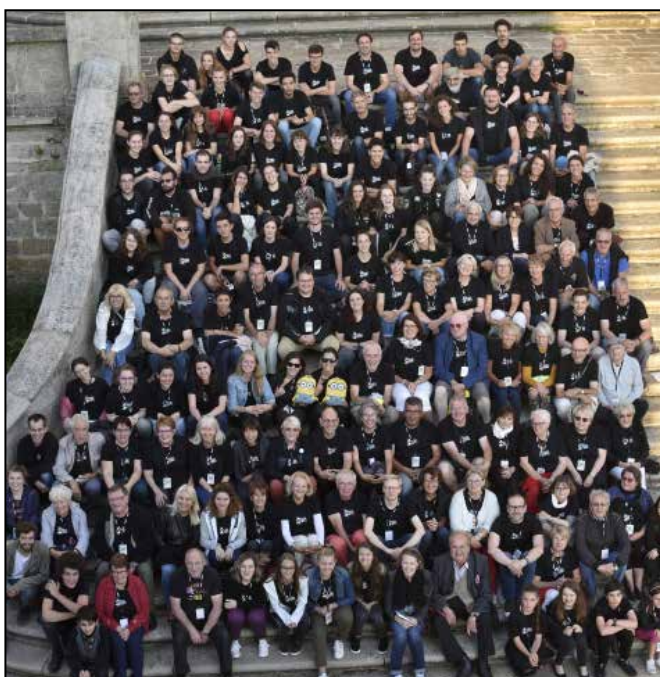
Équipe organisatrice du Festival 2019