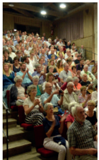
Auditorium Cziffra