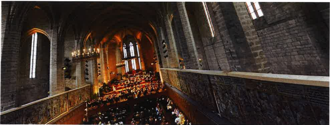
Festival de la Chaise- Dieu 2008

La 54e édition du festival du 20 au 30 août est annulée mais "dès l'automne 2020, le festival reprendra ses activités de résidence, dans le cadre de ses rendez-vous en saisons, et d'éducation artistique et culturelle"