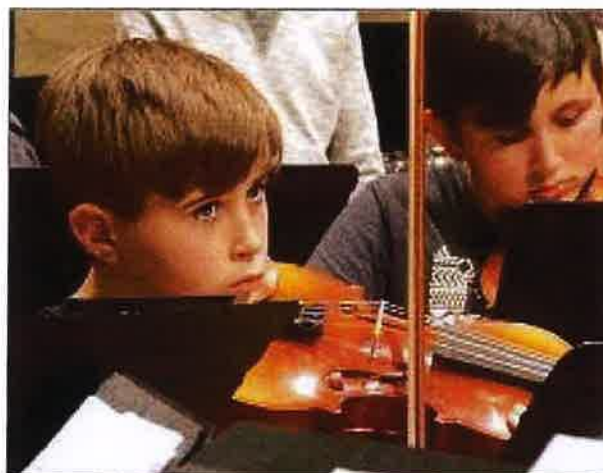
Les élèves, débutants en musique et scolarisés en CM2, peuvent déposer leur candidature.

Pour qui ? Les écoliers qui sont actuellement scolarisés en classe de CM2 et qui ne pratiquent pas d'instrument de musique peuvent postuler. Les places en internat ne sont pas réservées aux collé-