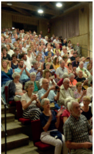
Auditorium Cziffra